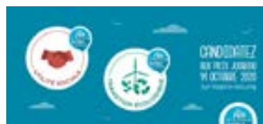
Les Bandeaux «Partenaire» du Mois de l'ESS