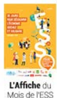
L'Affiche du Mois de l'ESS