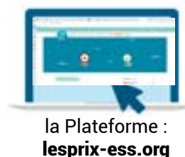
la Plateforme : lesprix-ess.org