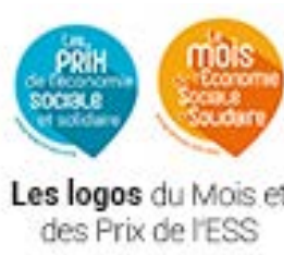
Les logos du Mois et des Prix de l'ESS