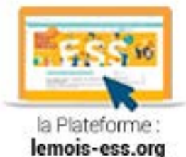
la Plateforme : lemois-ess.org

Les réseaux sociaux permettront de soutenir la visibilité de vos manifestations. N'hésitez pas à utiliser le « hashtag » #MoisESS2019 et/ou à identifier la CRESS @CRESS_IDF pour que nous puissions relayer vos événements.